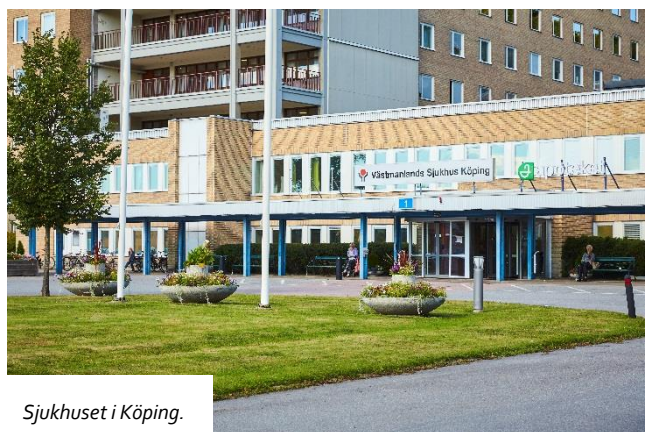
Sjukhuset i Köping.

Till skillnad från en del av våra politiska motståndare är vi övertygade om att det är helt nödvändigt att regionen, i sin egen organisation tar ansvar för samtliga sjukhus i länet. Därför ger vi ett tydligt besked: nej till privatiseringar av sjukhusen i Västmanland och ja till ytterligare satsningar i hela länet.