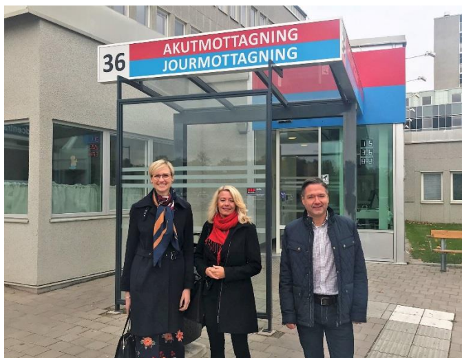
Västmanländska socialdemokrater utanför akuten vid Västerås sjukhus.

För oss Socialdemokrater är den jämlika vården en viktig fråga. Vi ser att det idag skiljer sig i hälsa mellan olika delar inom vårt län. Det skiljer sig mellan kommuner och mellan olika delar inom kommunerna. Vi måste se till att minska klyftorna i ohälsa. Det gör vi bäst genom att öka tillgängligheten och intensifiera det förebyggande arbetet i särskilt utsatta områden.